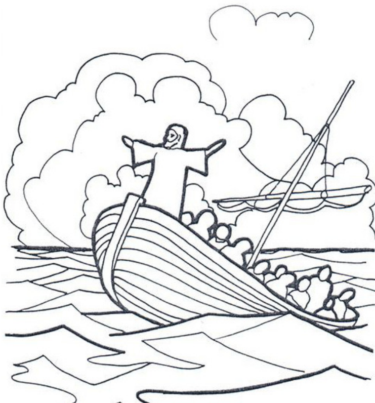
Jezus op het meer. "kom, we zijn weg"

Het is weer zo ver. Een heel jaar hebben we samen gezeten en af en toe zat je wel met de handen in het haar omwille van jouw klas. Maar ik vond het hier fijn! Bedankt. Ook dank aan de moekes van de refter en de opvang en de mensen van het onderhoud. Zonder jullie zou het op school niet zo goed verlopen! Dag vrienden, vriendinnen, Het is vakantie, ik zal jullie missen, weet je. En al heb ik je ooit eens lekker geplaagd, al draaide ik eens mijn rug naar jou, al liet ik je soms aan de kant staan, nu besef ik pas dat we mekaar echt nodig hebben. Het schooljaar is voorbij, ik maak het even stil en vraag aan onze Vader in de hemel glimlachend neer te kijken op ieder van ons en ons bij de hand te nemen gedurende die twee